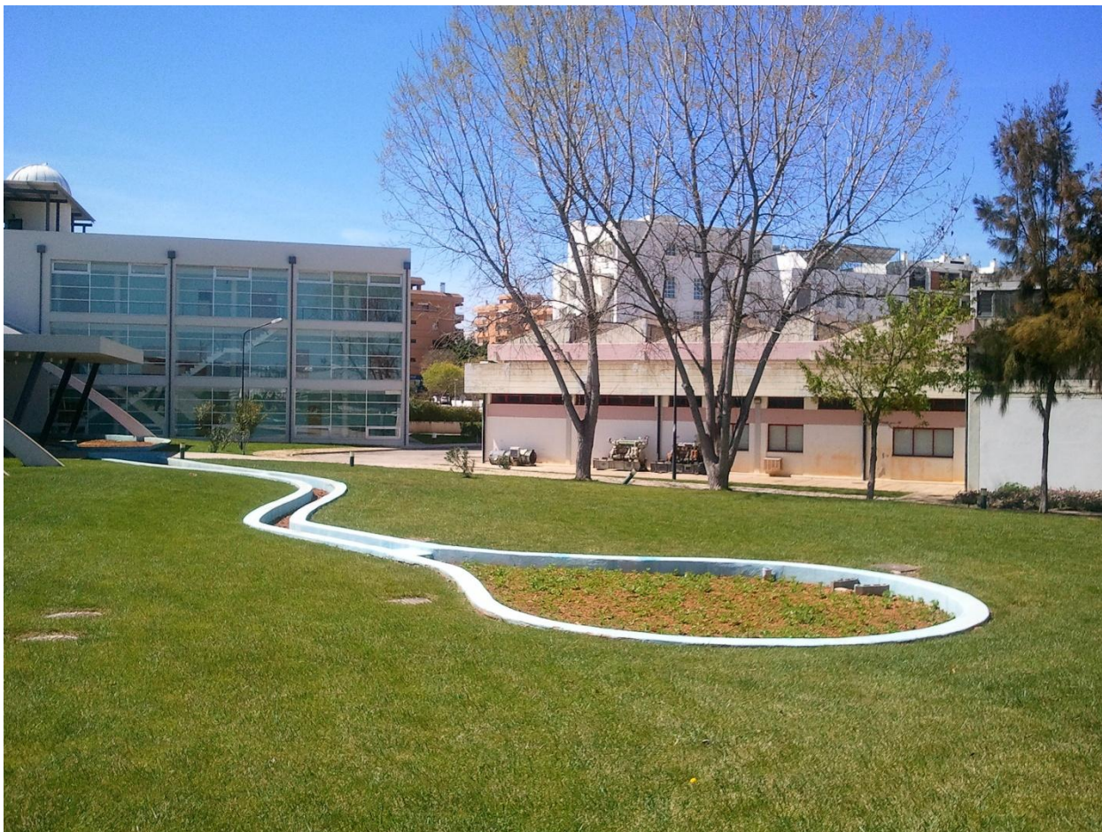
Фрагмент обустройства территории Университета (Penha)

Такая политика способствует тому, что гости Университета активно участвуют в соответствующих курсах и достаточно быстро адаптируются в национальной среде.