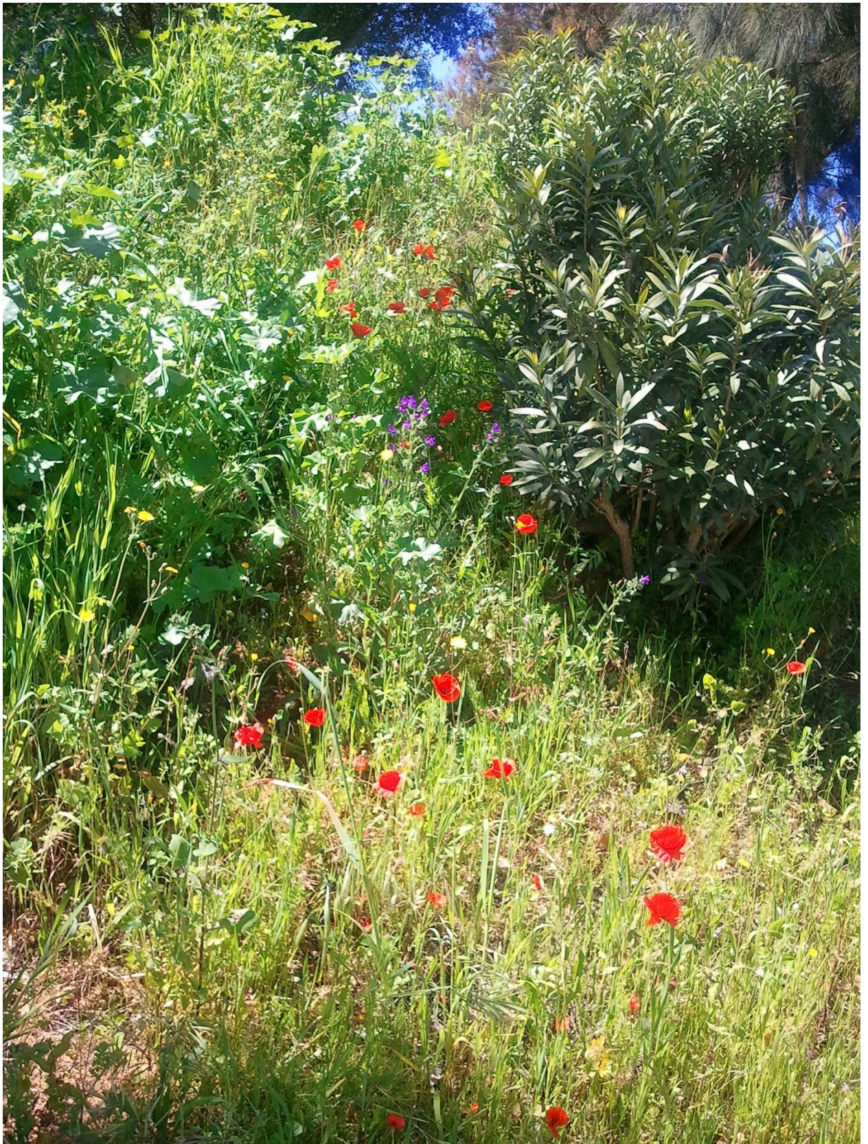
Нет, это не загородный пейзаж, это территория Университета весной (Ренна)