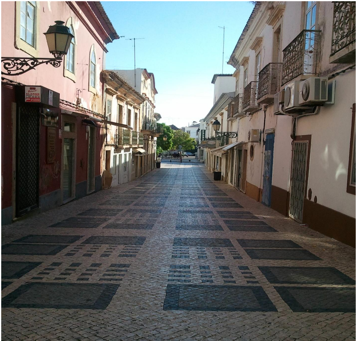
Calçada portuguesa – дороги Португалии

История Университета Алгарве насчитывает около 30 лет, Университет достаточно молод и в настоящее время состоит из трех кампусов: Penha, Gambelas и Saude - в городе Фару, а также в Портимао, включая следующие научные структуры: экономический факультет, факультет социальных и гуманитарных наук, факультет науки и технологии и политехнический. Также в Университете действует Школа наук о здоровье, Школа коммуникаций, Школа менеджмента, гостиничного бизнеса и туризма и Институт техники.