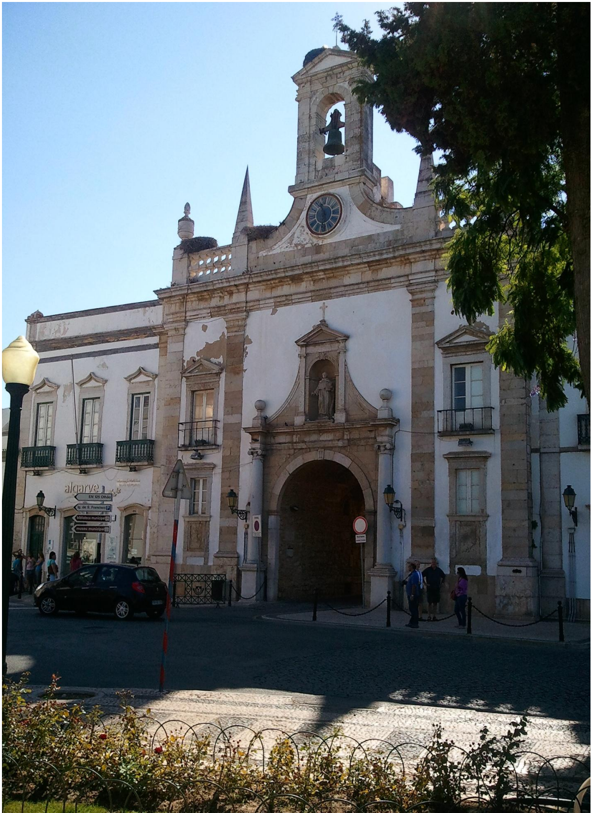
Центр Фаро (Faro velho) – исторические здания у входа в «старый город»