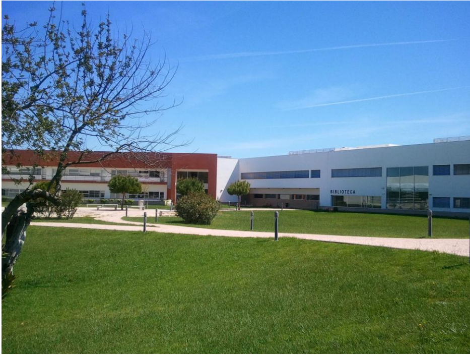
Библиотека в кампусе Penha