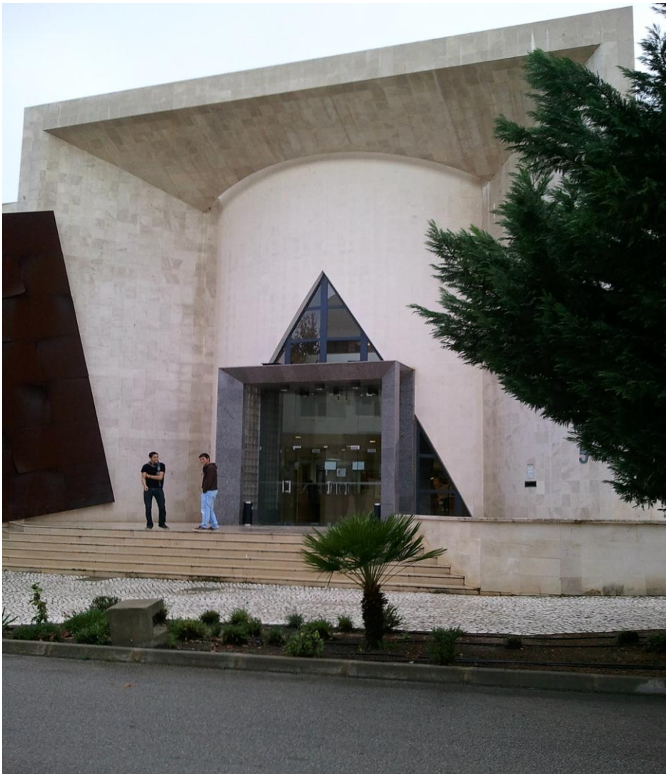
Библиотека в кампусе Gambelas