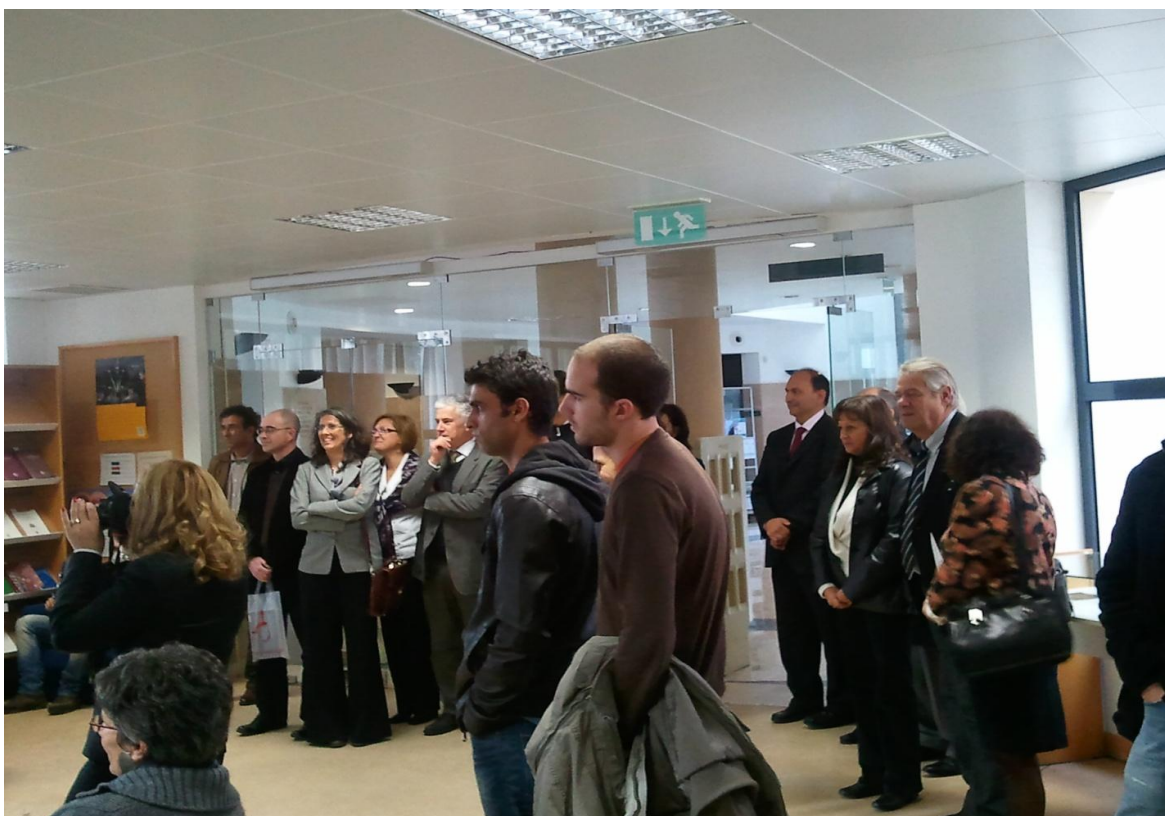
На таких мероприятиях всегда много заинтересованных и благодарных слушателей