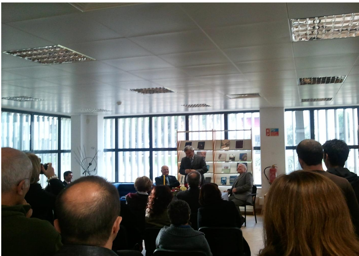
Одна из творческих презентаций в библиотеке кампуса Gambelas